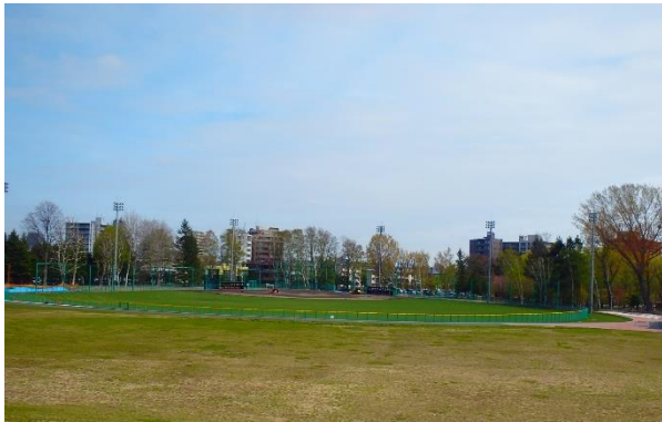
6月にオープンする坂下野球場のようす

平成30年6月15日に坂下野球場がリニューアルオープンします。軟式野球、ソフトボール等で利用できる有料施設です。美園駅から徒歩約5分の場所に位置しており、公共交通機関からのアクセスが非常に良い野球場です。また、ナイター照明を完備しており、夜20:00まで利用いただけます。 ※駐車場には限りがございます。 ご利用の際は、公共交通機関またはお車を乗り合わせてお越しください。たくさんのご利用をお待ちしております。 利用期間：6月15日から11月初旬 利用時間：5時から20時 利用料金：1時間1200円 ナイター照明料1時間2400円 問い合わせ先：月寒公園パークライフセンター 運動施設受付(011-813-1361)