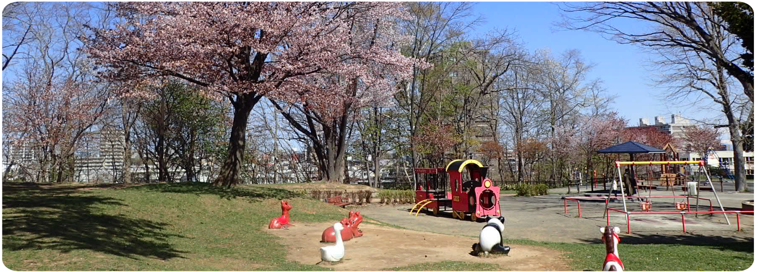
こどもひろば（2022年4月30日撮影）

今年は雪解けも早く、たくさんの方から施設のオープン日についてお問い合わせをいただいております。みなさんに安全にご利用いただくため、今しばらくお時間をいただく施設もありますので、ご了承ください。各施設のオープン予定日をご案内いたしますので、お出かけの参考にさせていただければと思います！